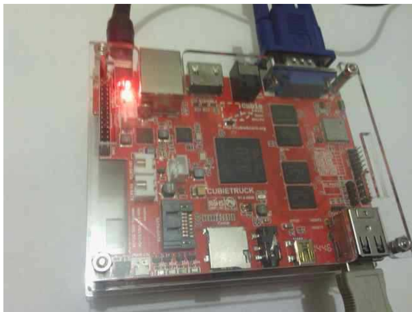
Illustration 1: CubieTruck in Work

Der Text umfaßt die Vorbereitung, Erstinbetriebnahme, Installation weiterer praktischer Pakete, Anwendung der Pakete/Anwendungen und Installation von Treibern.